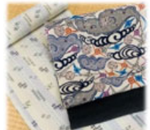
琉球緋・紅型(沖縄)