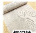
塩沢袖・十日町袖(新潟)